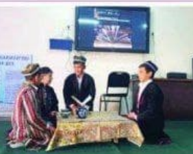
Она тили - бу миллатнинг руҳидур...