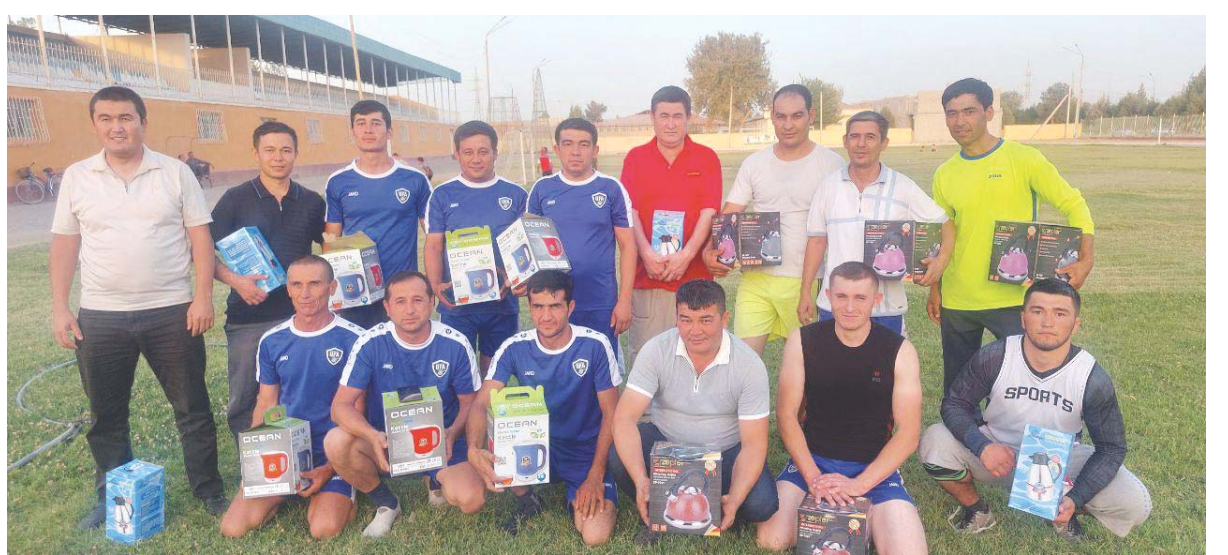
Қумқўрғон туман тиббиёт бирлашмасида Ўзбекистон Республикаси мустақиллигининг 31 йиллиги муносабати билан "Янги Ўзбекистонда эл азиз, инсон азиз!" шиори остида спорт тадбири бўлиб ўтди.

Унда тиббиёт ходимлари ўртасида спортнинг футбол тури бўйича мусобақа ўтказилди. Ғолиб бўлган жамоаларга туман тиббиёт бирлашмаси касаб уюшмаси кўмитаси томонидан фахрий ёрлик ва эсдалик совғалари топширилди.