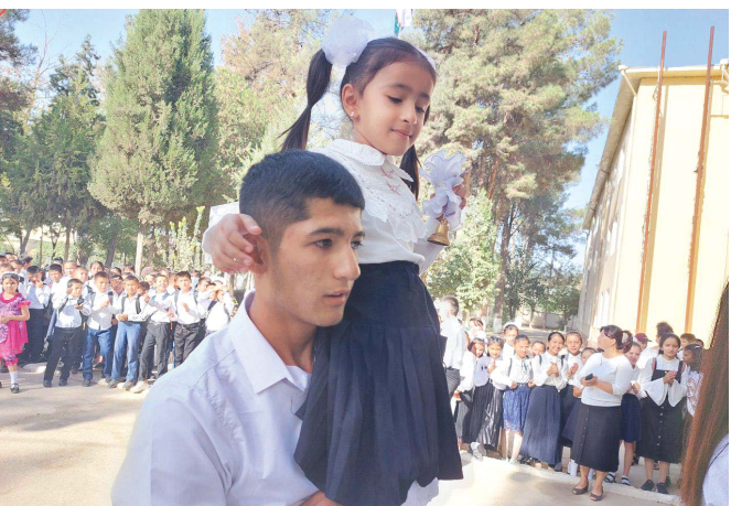
Пинҳон орзуларим чорлаб мактабга, Олис истикболдан этиб илк оғох. Тенгдошларим бўй ўлчаб тизилдик сафга, Кўнғироқ ёқимли янгради ногоҳ.

Мароқли ёзги таътилдан сўнг куз фаслининг илк кунларида янги ўқув йили бошланди. Қўлларидан гул, қалбда ҳаяжон билан севимли мактаби томон ошиқаётган жажжи ўқувчи-ёшларнинг севинчлари чексиз. Туманимиз ёшларини ўз бағрига чорлаган барча умумтаълим мактабларида би-